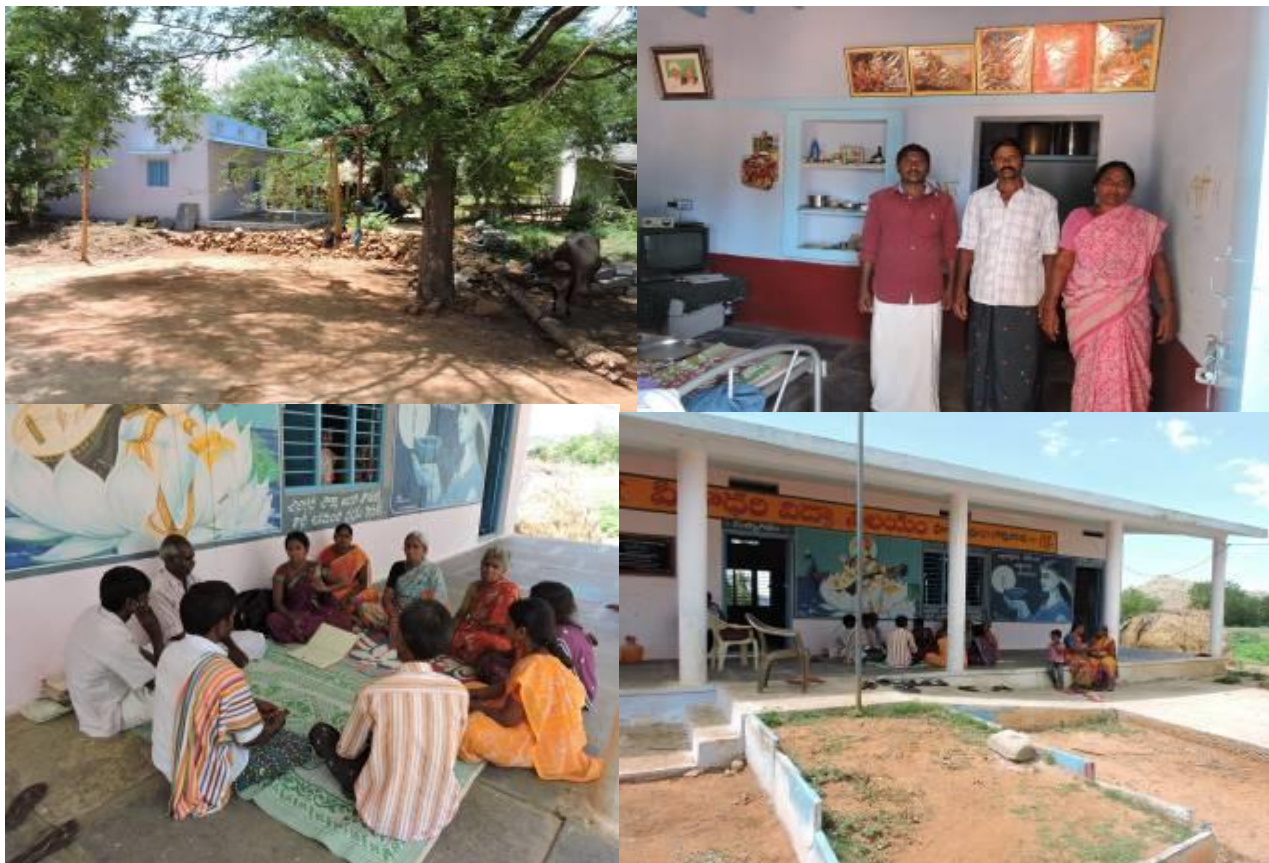
Colonia de viviendas construida en de Kolimpalyam